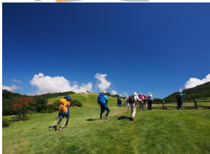
▲ 夏空の下で芝生トレック