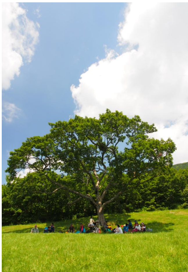
▲ 木陰でコーヒータイム